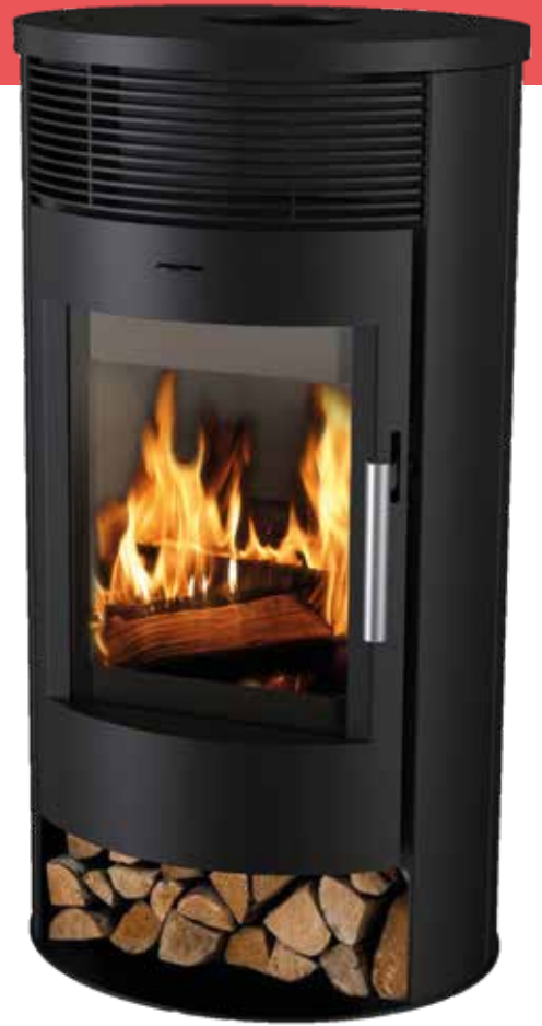
ESTUFA LEÑA ÉLIDE VENTILADA Estufa de leña ventilada con diseño nórdico. Potencia 7,79 kW. Salida de 120 mm. Peso 115 kg. Medidas: 1020x490x560 mm.